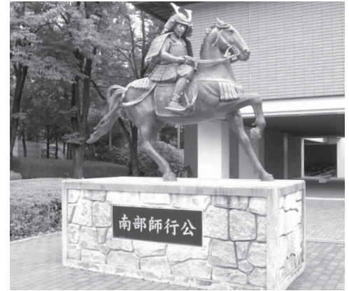
南部師行銅像 青森県八戸市・八戸市立博物館

阿曾沼六郎太郎、安保刑部丞実光、安東平次郎兵衛尉」がこれで、鎌倉中期の奥羽に配置された鎌倉御家人の名が知られる。この人々がだいたい吉野朝期までつづき、建武の改革をめぐって南北両党に分かれて紛争している。その紛争に現われてくる人々を現存する根本資料のみから確認すると、