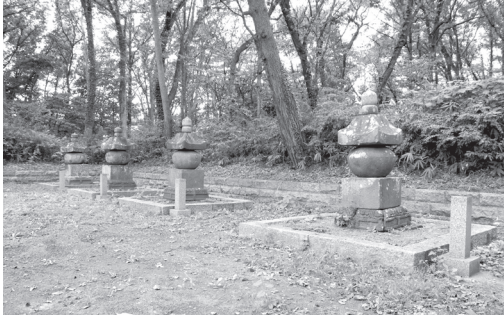
南部光行の墓（右手前） 岩手県盛岡市・聖寿寺

のほか十八名が見えるが、南部家の直系には太郎と称する者はなく、祖光行以来、二郎あるいは三郎を通称としている。しいて捜すと、光行の庶子、長男行朝は太郎と称し、庶子のため別家をたてて糠部郡一戸を領したとあり、時代的には一致するが、どうだろうか。 『吾妻鏡』によると、承久三年（一二二二）五月と六月に官軍と對抗するため上洛した鎌倉軍の中に、奥羽在住の諸士が多く見える。「陸奥六郎有時、南條七郎、安東藤内左衛門尉、伊具太郎、横溝五郎、安藤左近将監、阿曾沼次郎親綱、成田五郎、奈良兵衛尉、曾我太郎、